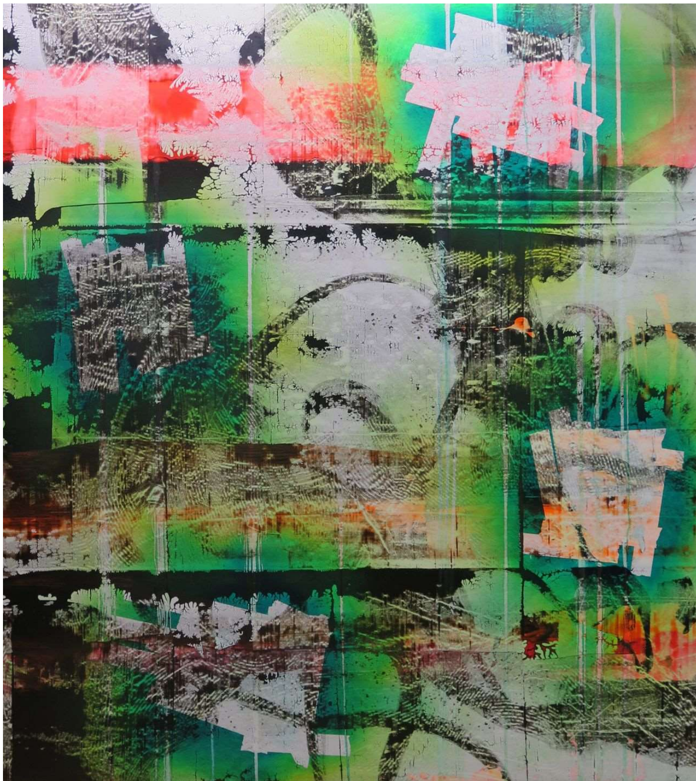
© Bernard Gilbert, Number 342 , acrylique et huile sur toile de polyester, 2019.